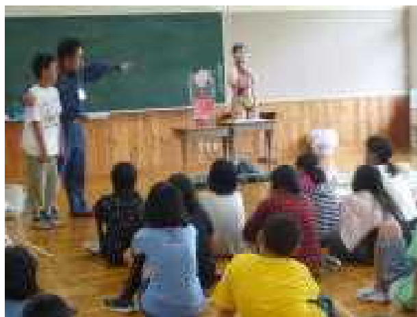
【5/6年命の学習 消防署高山分署の皆さん】

本校は村教委の共育コミュニティ構想に参画し、地域に開かれた、地域と共に教育活動を行うコミュニティスクールとしての理念を持って取り組んでおります。ここでは紹介しきれない程、1学期も学校にたくさんの地域の方々に来校いただきボランティアで教育支援にあたっていただきました。心より感謝申し上げます。学校の敷居は低いです。遊びや語り、見守り活動、掃除や給食の配膳、調理実習やミシン指導の支援など、得意な事でもそうでなくても、皆さん無理なく楽しんでやってくさっています。教育活動の充実とともに安全面でも助かっています。高山村の教育力、地域の底力、暖かさを感じます。まさに高山村の魅力はここにあると思います。地域の方々に支援していただくときは、子ども達も嬉しそうです。「地域と学校が手を携えて、地域の子どもは地域で育てる」理念の元、地域に開かれた教育活動を展開してまいります。