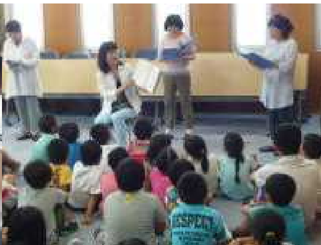
【月に1回フレデリックお話の会の皆さん】

学校支援ボランティアの皆さんのおかげで、学校が活気づいてきたように思います。子どもたちのためにこんなにも多くの外部の方々が来校し、支えて下さっていることに感謝でいっぱいです。学校支援ボランティアは随時募集中です。いつでも教頭または担任に声をかけてください。登録用紙をお渡します。お待ちしております。