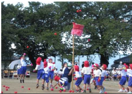
1年「あいうえおでぼんぼん玉入れ」

1年生は小学校に入学して初めての運動会、6年生にとっては小学校最後の運動会でした。短距離走ではどの子も一生懸命に走り抜ける姿、各学年の学年競技では友だちと協力する姿、綺麗にそろった集団行動の演技などがとても輝いていました。学年表現では、どの学年も心を合わせて演技している姿が光っていました。コロナ禍の中で感染防止をしながら練習をして準備してきた中ではありましたが、子どもたちの姿が見ている人の心に感動を与える運動会になりました。今年は「赤」が勝ちましたが、どの子も成長を見せた運動会となりました。また、5・6年児童は、運動会を支える係活動をしっかり行い、とても立派でした。運動会で成長したことをこれからの実りの秋に活かして行ってほしいです