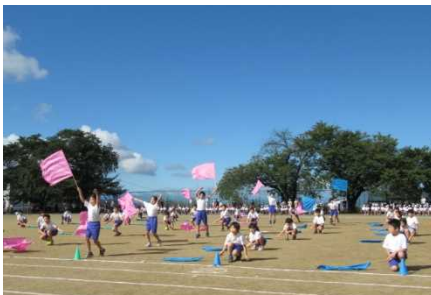
4年「羽ばたけ！われらのカイト」