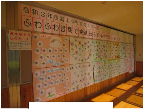
どうぞよろしくカード