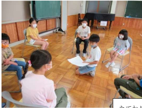
たてわり班なかよし集会