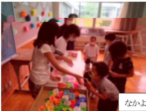
なかよし学級集会