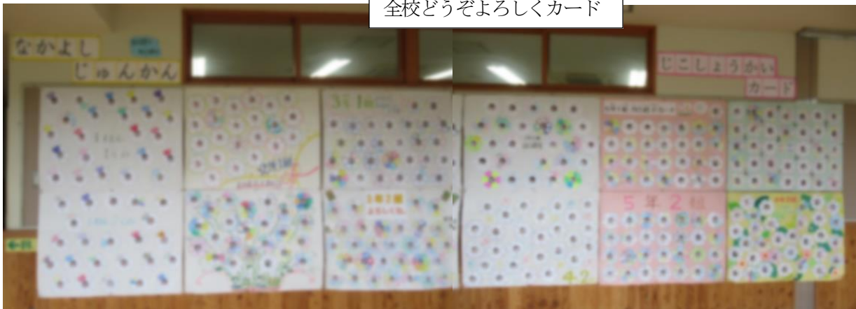
全校どうぞよろしくカード

なかよし旬間（6月22日～7月10日）では、全校児童が「どうぞよろしくカード」で自分の好きなことを紹介するカードを作り、1階廊下に掲示しました。一人一人の児童の好きな物や良さが書かれています。友だちと仲よくなるには、相手のことを知ることが大切です。新型コロナウイルス感染防止対策のため、全校でのなかよし集会は行わず、なかよし学級で集会を行いました。高学年の学級で集会の内容を企画し準備を進めて低学年の子どもたちと楽しく交流していました。どのなかよし学級でも上級生が下学年の児童のことを思いやりながら楽しんでもらえる集会になっていました。高山小学校では、「つながる交流活動」を大事にしていますが、子どもたちにとっても異年齢交流が相手の気持ちや立場を考えるととてもいい経験になっています。