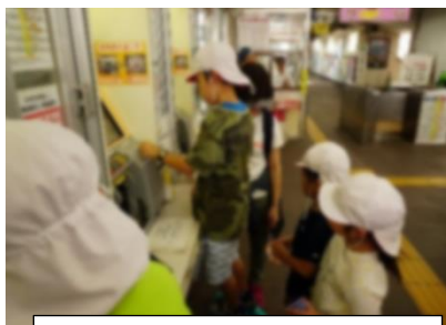
2年 臥竜公園 須坂駅