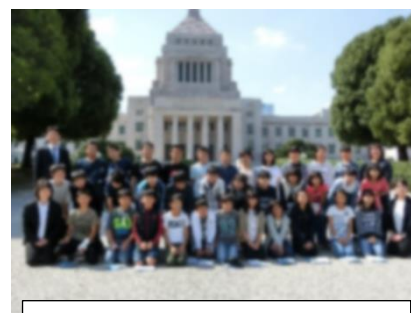
6年 修学旅行 国会議事堂