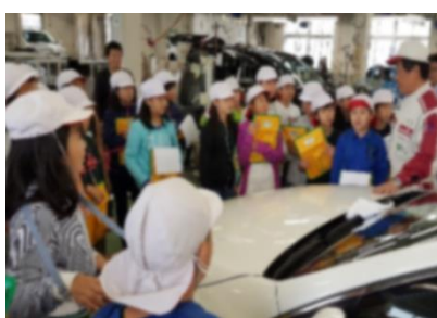
5年 トヨタUボディ&ペインティング