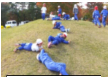
1年 秋探し チャオル