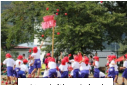
1年 バブリー・たまいれ

今年の運動会では、赤も白も力を合わせ心を合わせ、どの子も一生懸命楽しそうに、跳んだり走ったり踊ったり全力で取り組んでいました。1年生は小学校に入学して初めての運動会、6年生にとっては小学校最後の運動会でした。短距離走ではどの子も一生懸命に走り抜ける姿、各学年の学年競技では友だちと協力してプレーする姿、綱引きや騎馬戦では作戦を立てて駆け引きする姿がとても輝いていました。学年表現では、どの学年も心を合わせて演技している姿が光っていました。見ている人が感動する運動会でした。今年は「白」が勝ちましたが、どの子も成長を見せた運動会となりました。また、高学年児童は、運動会を支える係活動をしっかり行い、とても立派でした。運動会で成長したことをこれからの実りの秋に活かして行ってほしいです。