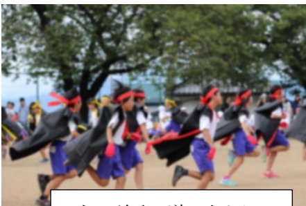
4年 前略、道の上より