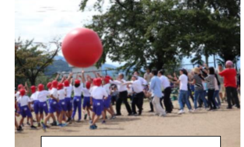
全校PTA来賓 大玉送り