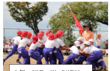
3年 COME ON BAMBOO