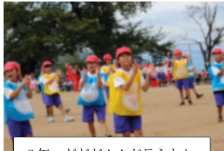
2年 どどど!! ドラえもん