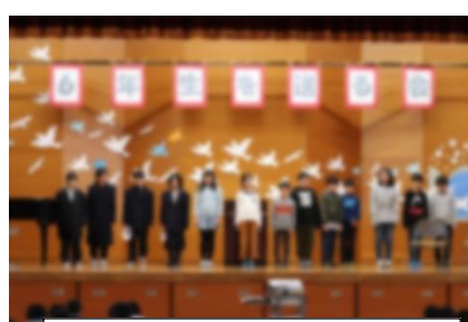
5年 寸劇・スライド