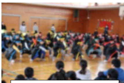
4年 前略、道の上より